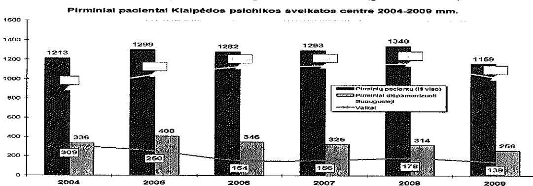
Grafikas Nr. 3

Nežymiai sumažėjo ir nedispanserizuotų pacientų skaičius (grafikas Nr. 2).