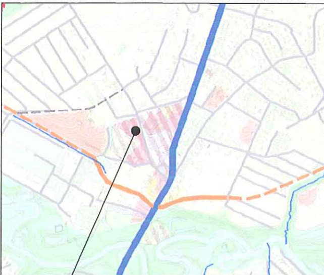
Planuojamas žemės sklypas Dvaro g. Nr. 7

Greta planuojamo žemės sklypo bendrajame Klaipėdos miesto plane nepažymėta planuojamų naujų gatvių.