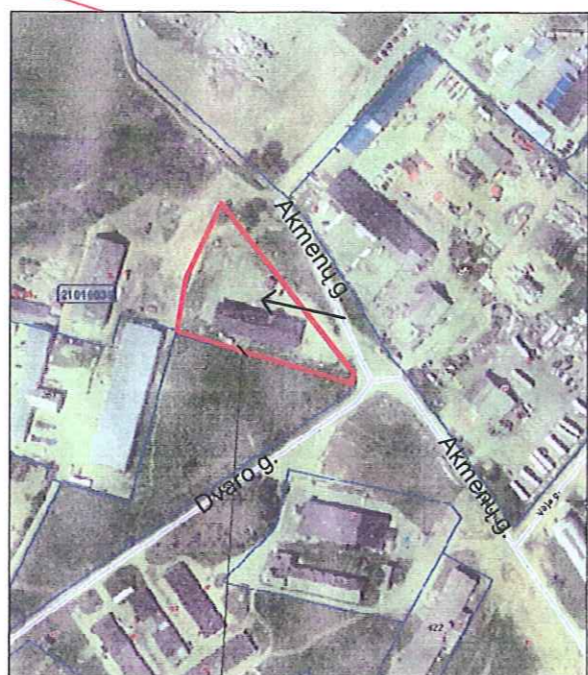
Planuojamas žemės sklypas

Vandentiekį numatyta tiekti iš artimiausių vandentiekio tinklų, buitines nuotekas planuojama nuvesti į artimiausius buitinių nuotekų tinklus. Elektra esama. Šildymas galimas iš esamo dujotekio arba šilumos tinklų. Įvažiavimas - iš Akmenų gatvės.